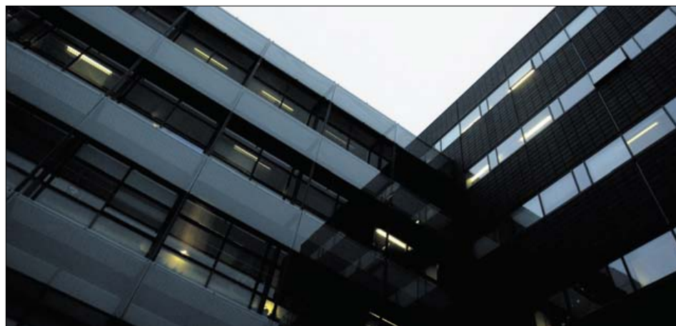
Handelshøjskolen på Frederiksberg. Blev den solgt for dyrt i foråret 2008?

Skat oplyser, at man på grund af tavshedspligt er afskåret fra at kommentere den konkrete sag.