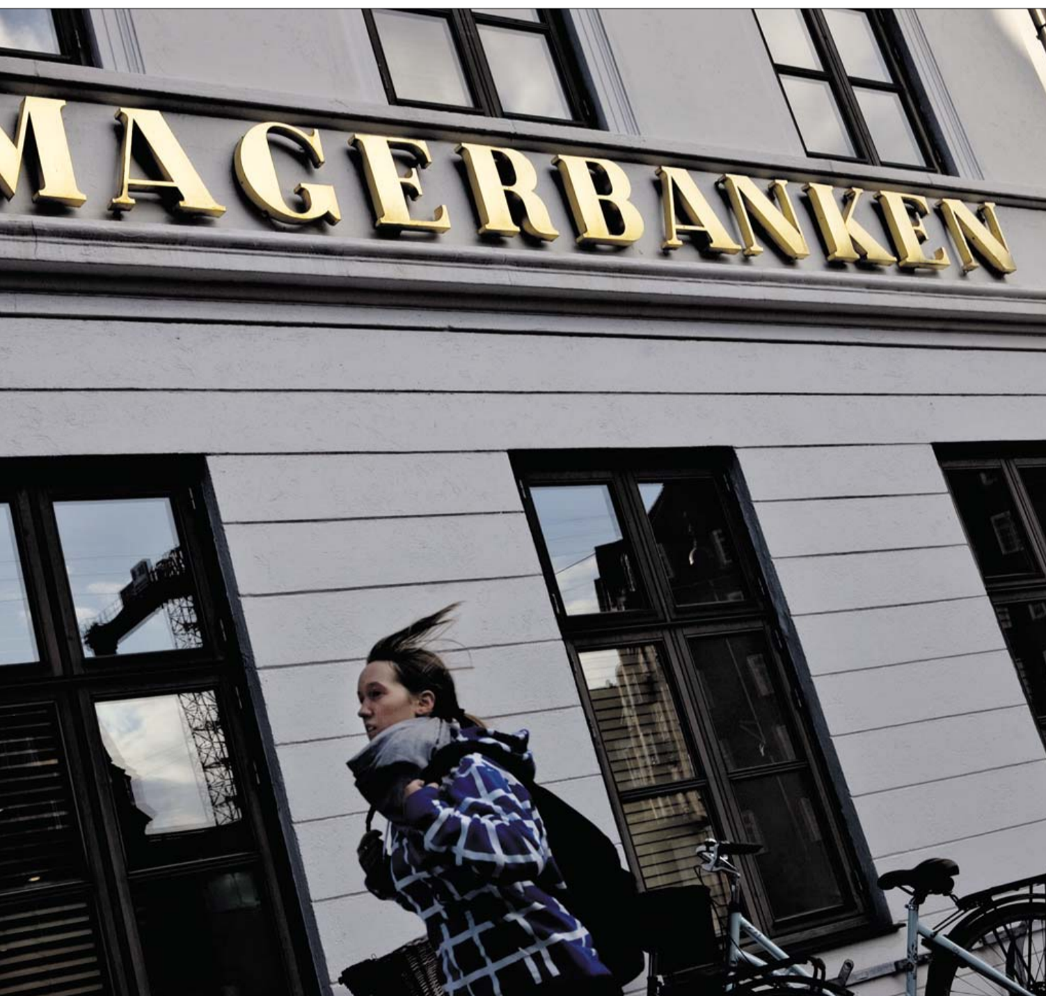
Amagerbanken kunne have været en solid bank i dag, mener borgmester og tidligere afdelingsdirektør.